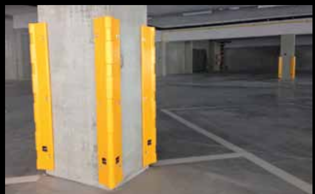
► Protector PCP / Säulenschutz