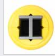
Lässt sich an runden, viereckigen, achteckigen und rechteckigen Säulen anbringen

Unser Programm bietet qualitativ hochwertige, ausgefeilte und effiziente Säulenschutzsysteme für Ihre Pfeiler, Säulen und Gebäude. Diese Schutzelemente aus Polypropylen zeichnen sich durch eine enorm hohe Stoßfestigkeit aus und sind standardmäßig in Gelb erhältlich, einer Farbe, die in der Regel zur Kennzeichnung von Sicherheitsgefahren verwendet wird. Dank ihrer „Active Memory“-Eigenschaft bewahren sie nach jeder Kollision ihre ursprüngliche Form bzw. Position. Da Kunststoffe weder rosten noch lackiert werden müssen, präsentieren sich diese Schutzelemente als kostengünstige Lösung für jedes Lager.