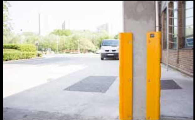
► Protector PCP / Säulenschutz