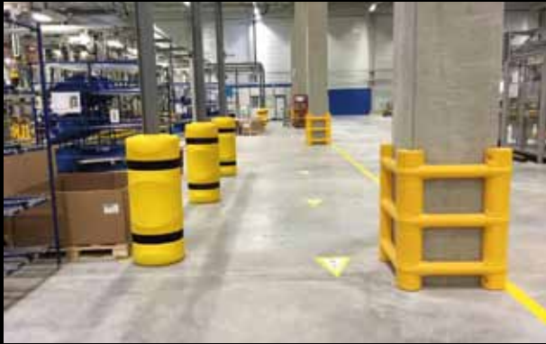
► Universal – PKP 150 / Säulenschutz