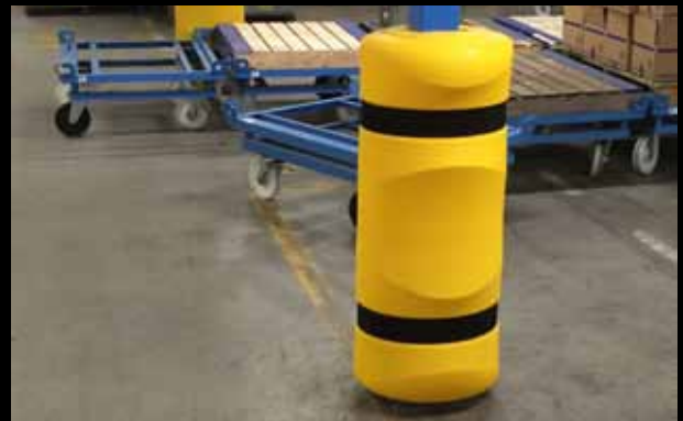
► PKP 150 / Säulenschutz