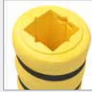
Erhältlich in verschiedenen Formen/Größen