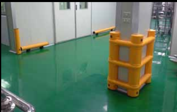
► Universal PKP / Säulenschutz