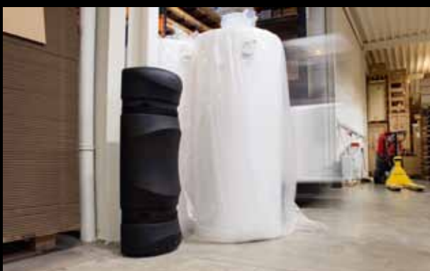
► PKP 150 / Halber Säulenschutz