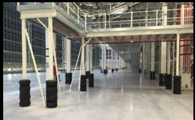
► PKP 150 / Säulenschutz in Schwarz