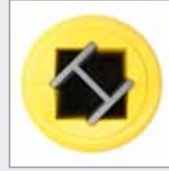
Dank Aussparungen auch für kürzere Säulen unter Ecken geeignet