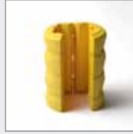
Besteht aus zwei getrennten Teilen